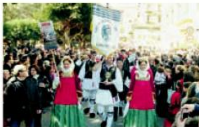
Παρέλαση στους γραφικούς δρόμους του Αγκριτζέντο, όπου κάτοικοι και επισκέπτες θαύμασαν τις ελληνικές παραδοσιακές φορεσιές.