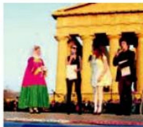
Η τελετή βράβευσης πραγματοποιήθηκε στο λόφο του αρχαίου ελληνικού ναού της Ομόνοιας.