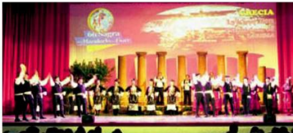
Οι χορευτές του Λυκείου Ελληνίδων Λάρισας στο επιβλητικό θέατρο Palacongressi.