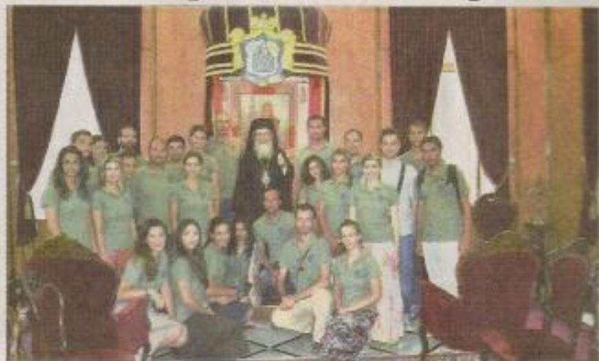
Στο Πατριαρχείο Ιερουσαλύμων με τον πατριάρχη Θεόφιλο

Συνεχίζεται με μεγάλη επιτυχία η περιοδεία του Λυκείου των Ελληνίδων στο Ισραήλ. Την περασμένη Κυριακή έδωσε παράσταση στο επιβλητικό θέατρο Palace of Culture στη Rishon LeZion, τέταρτη πόλη σε πληθυσμό στο Ισραήλ. Το θέατρο ήταν κατάμεστο από χιλιάδες θεατές που πήγαν να παρακολουθήσουν την παράσταση. Χάρη στις εντυπωσιακές εγκαταστάσεις του, την ηχητική υποδομή και το σύγχρονο εξοπλισμό το Λύκειο των Ελληνίδων κατάφερε να πραγματοποιήσει μία από τις αρτιότερες εμφανίσεις του. Την επόμενη ημέρα ακολούθησε άλλη μία επιτυχημένη παράσταση στο εντυπωσιακό θέατρο του Τελ Αβίβ, στο Θέατρο του Στρατιώτη, ενώ την Τρίτη το βράδυ στο Hod Hasharon. Παράλληλα την ίδια μέρα είχε προηγηθεί επίσκεψη της αποστολής του Λυκείου των Ελληνίδων και πάλι στην Ιερουσαλήμ. Εκεί τα μέλη του Λυκείου των Ελληνίδων έγιναν δεκτά από το Πατριαρχείο Ιερουσαλύμων.